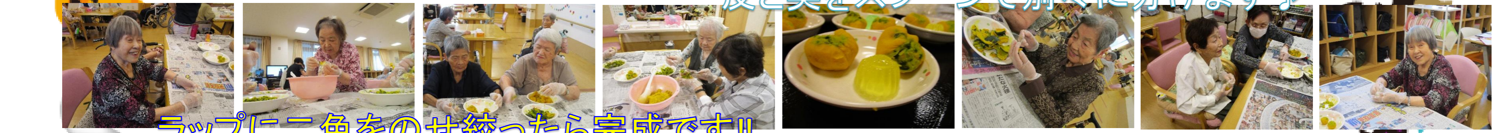
ラップに二色をのせ絞ったら完成です!!