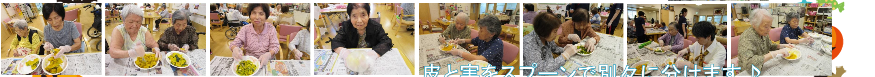
皮と実をスプーンで別々に分けます♪