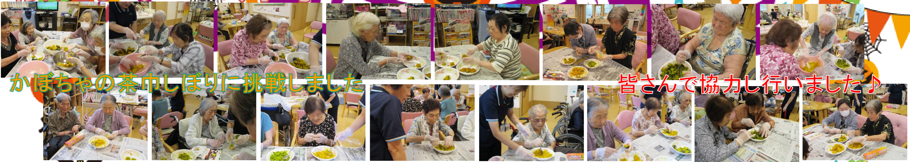
かぼちゃの茶巾しぼりに挑戦しました