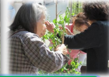
さやえんどうの収穫！！