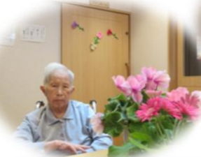
シクラメンのお花と一緒に♡