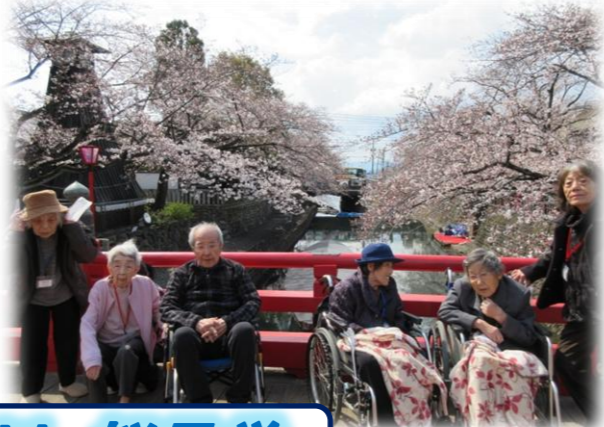
大垣水門川 桜見学