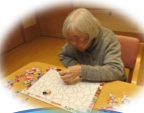
パズルを一生懸命取り組んでいます