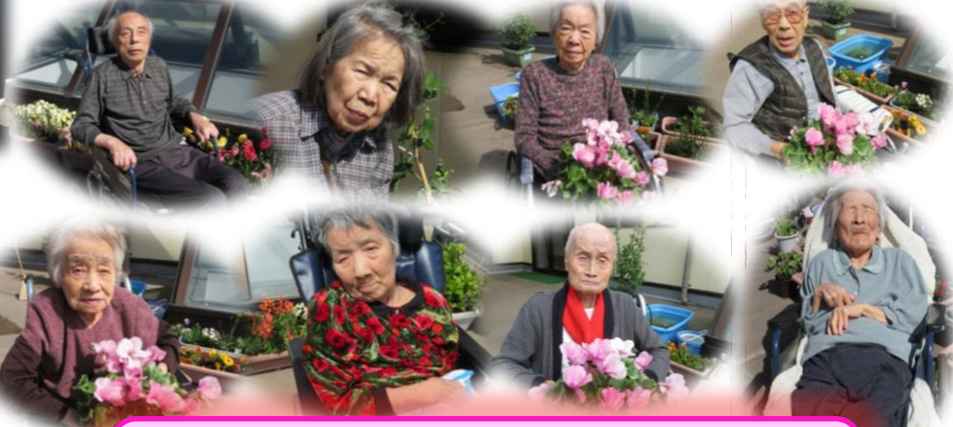
バルコニーにて日向ぼっこしました☆