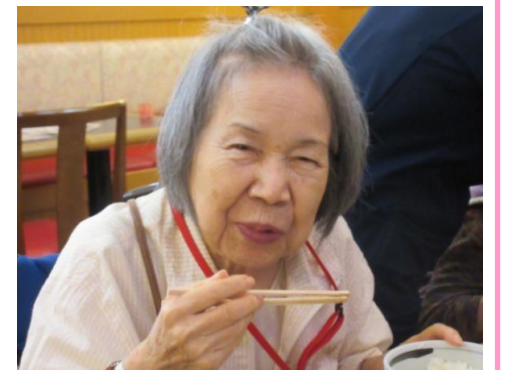
安八町の喫茶店へモーニングに行ってきました！